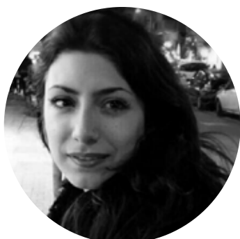
Βίκυ Κάλλα Viky Kalla