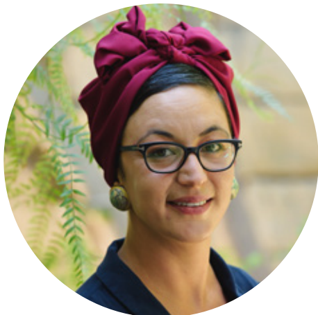
Έλενα Κοτασβήλι | Σκηνικά Elena Kotasvili | Set Design