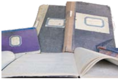
Πρακτικά του Δήμου Λεμεσού από το 1878